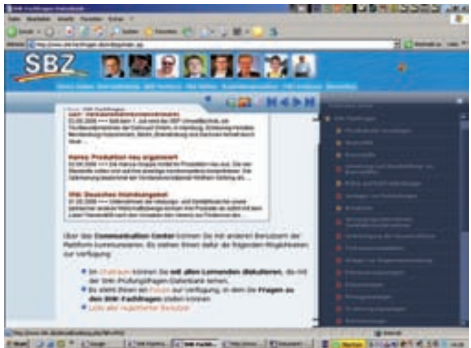
Täglich gibt es aktuelle Meldungen rund ums Branchengeschehen. Die Fotos aller gerade angemeldeten Nutzer werden im oberen Bildschirmbereich angezeigt. Wer nicht entdeckt werden möchte, kann diese Funktion deaktivieren und ist dann unsichtbar