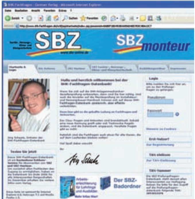
Die Nutzung der Datenbank ist kostenlos und bis zum Ende des Jahres jedermann zugänglich. Lediglich eine Anmeldung ist erforderlich

Die Antwort sollte man in das Textfeld unter der Frage eingeben. Dann hat man etwas schwarz auf weiß und der Vergleich mit der Lösung fällt leichter. Die Lösung wird angezeigt, wenn man auf das Glühlampensymbol klickt. Häufig gibt es hier auch noch eine Zusatzinformation. Sie ist für die korrekte Beantwortung einer Frage zwar nicht nötig, liefert aber Hintergrundwissen oder Details für den, der mehr wissen möchte. Das wichtigste Wissen ist ganz sicher die Information darüber, wie viel man weiß. Wer sich diesbezüglich testen möchte, der muss keine Strichliste über die korrekt beantworteten Fragen führen.