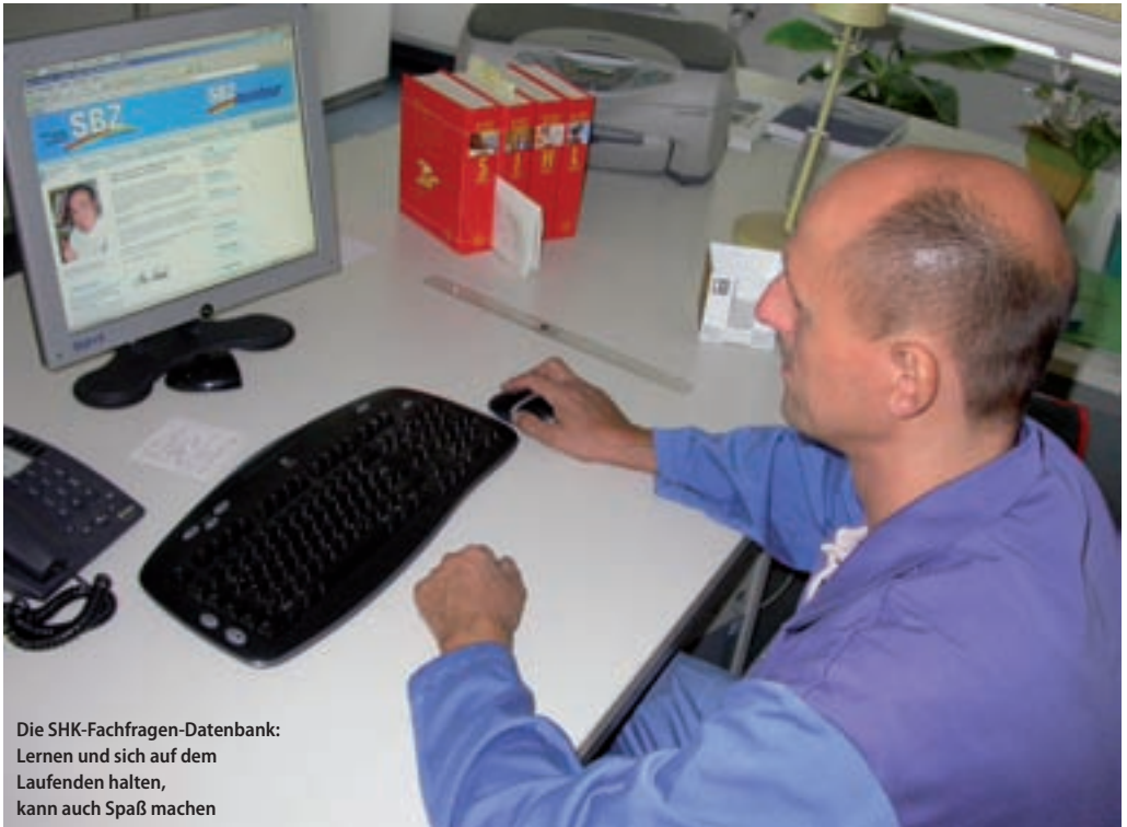
Die SHK-Fachfragen-Datenbank: Lernen und sich auf dem Laufenden halten, kann auch Spaß machen