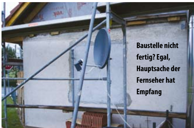
Baustelle nicht fertig? Egal, Hauptsache der Fernseher hat Empfang