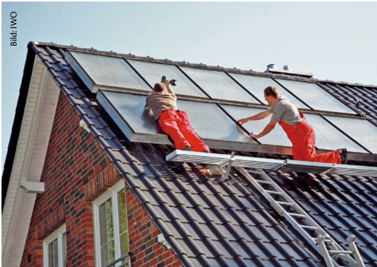
Der Einsatz einer Solaranlage ist eine Möglichkeit, das neue Gesetz zu erfüllen