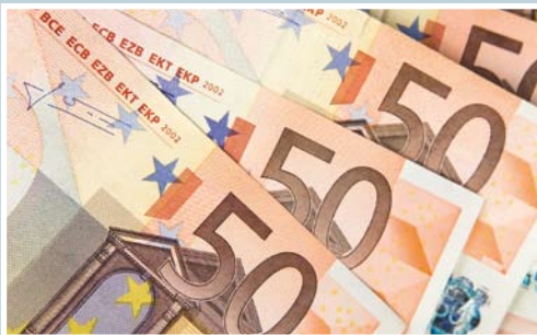
Teuer wird es, wenn man ohne Ausweis erwischt wird

Bis Ende 2007 durfte der Zoll bei Baustellenkontrollen anstelle des Sozialversicherungsausweises auch die Vorlage des Personalausweises akzeptieren. Diese Möglichkeit gibt es ab 2008 nicht mehr. Damit müssen auch Anlagenmechaniker den Sozialversicherungsausweis (mit Foto) bei Arbeiten auf Baustellen mit sich führen. Sollte die Zollverwaltung einen Arbeitnehmer ohne den Sozialversicherungsausweis auf einer Baustelle antreffen, drohen Bußgelder bis zu 1000 € für den betroffenen Arbeitnehmer. Arbeitgeber sind verpflichtet, ihre Mitarbeiter darauf hinzuweisen.