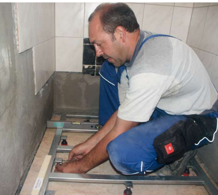
Dann erfolgt die genaue Justierung, die auch unter den beengten Baustellenverhältnissen gut von der Hand geht