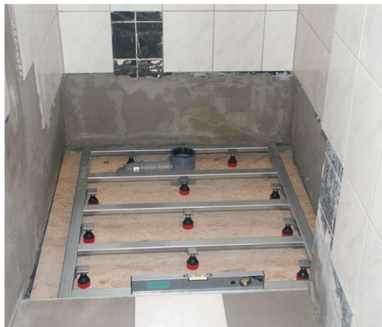
Der Panel-Unterbau ist nun passgenau ausgerichtet und der Geruchverschluss vorbereitet

Rinne ein. Diese Systemlösung war für die dort vorliegende Einbausituation geradezu prädestiniert und bot noch einen weiteren wichtigen Vorteil: Mit dem System konnte Peter Bilstein die meisten Arbeitsschritte in eigener Regie erledigen. Die Mitwirkung des Estrichlegers und des Fliesenlegers beschränkte sich auf wenige Handgriffe. Der Estrichleger hatte nur eine vormarkierte Estrich-Aussparung zum Einsetzen des Montagepanels herzustellen. Mit der Erzeugung des unverzichtbaren Gefälles im Duschbereich hatte er nichts zutun. Für Gefälle sorgt bei dem System der Anlagenmechaniker,