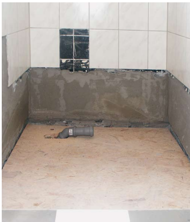
Der Estrichleger hat den Bereich, in dem die Dusche entstehen soll, ausgespart – nun kann es losgehen