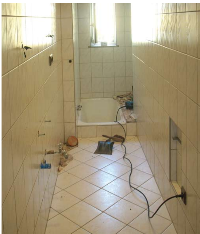
... wo sich noch kurz zuvor eine Wanne befand, die dem Benutzer beim Ein- und Ausstieg akrobatische Fähigkeiten abverlangte