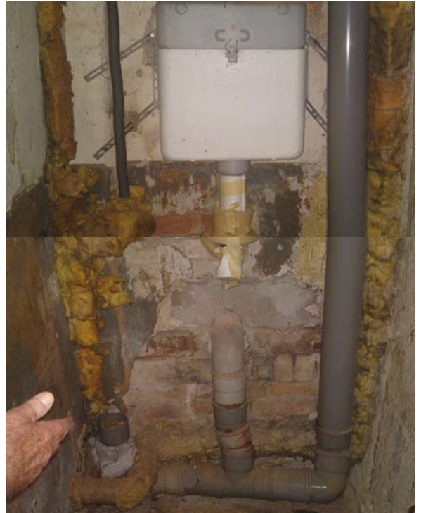
Hinterwandspülkasten ist ja vielleicht noch innovativ, aber 87°-Abzweig in liegender Leitung ... ?