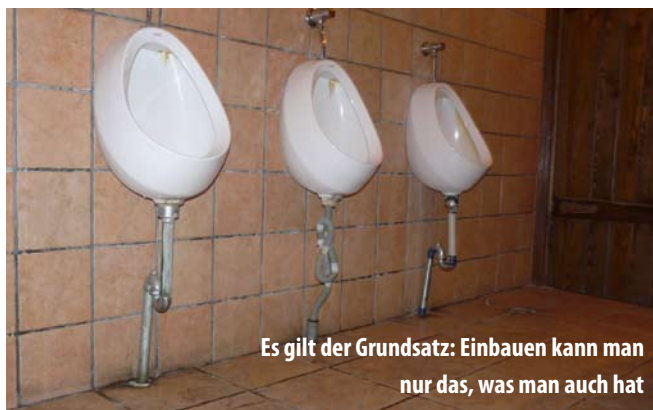
Es gilt der Grundsatz: Einbauen kann man nur das, was man auch hat