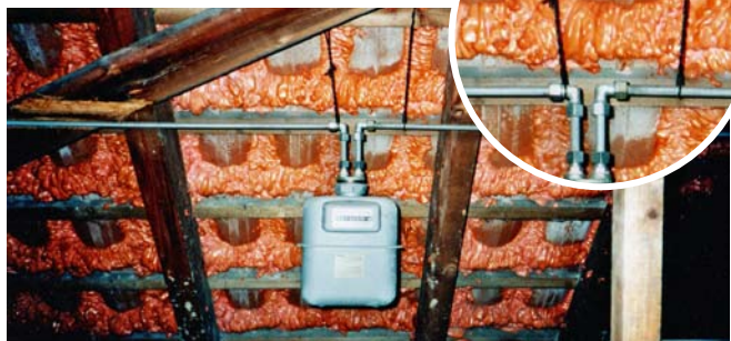
Mit Packband an die Dachlatte gebunden – schlimmer geht's nicht!