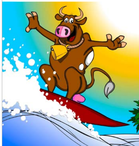
Bild links: Gute Bilder sind Bilder mit Emotionen, wie z. B. Witz, Action, Farben usw.

mit. Dein Kollege holt ihn später bei Dir auf der Baustelle ab.“