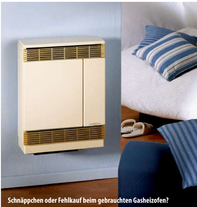
Schnäppchen oder Fehlkauf beim gebrauchten Gasheizofen?

Grund: Ältere Modelle haben keine Vorrichtung zur Abgasüberwachung und dürfen deshalb nicht mehr als Austauschgerät zum Einsatz kommen. Das vermeintliche Schnäppchen erweist sich dann als teurer Fehlkauf. Die Oranier-Gruppe, zu der auch der Hersteller Justus gehört, bietet ihren Kunden hierzu einen besonderen Service: Anhand der Gerätenummer können diese telefonisch unter (06462)9230 erfragen, ob ihre Gasöfen der Marken Oranier oder Justus bereits mit einer Vorrichtung zur Abgasüberwachung ausgestattet sind – oder ob eine Investition in moderne Heiztechnik sinnvoller wäre.