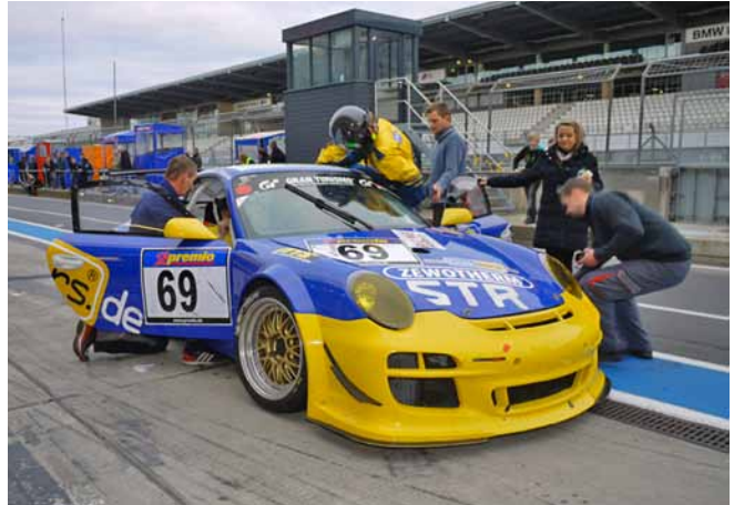
Auf dem Beifahrersitz konnten Anlagenmechaniker echtes Race-Feeling erleben

Zewotherm feiert in diesem Jahr sein zehnjähriges Bestehen. Dafür lud Zewotherm im Oktober 2011 vorab die Gewinner eines Preisausschreibens zu einem besonderen Erlebnistag ein. Nach der Begrüßung und einer kurzen Werksbesichtigung ging es zum Nürburgring. Dort wartete bereits der Trainingslauf zum 36. Münsterlandpokal des Deutschen Motorsportverbands, die Vorbereitungen in der Boxengasse liefen bereits auf Hochtouren. Die Gewinner konnten direkt am Renngeschehen, auch mit einer Copilotfahrt über den Nürburgring teilnehmen. In Vorbereitung auf die Mitfahrmöglichkeit wurden alle Teilnehmer mit Original-Rennanzügen ausgestattet und auf die bevorstehende Fahrt vorbereitet. Nervös waren fast alle Beifahrer, das wich aber schnell der Begeisterung für das Live-Rennerlebnis am Nürburgring.