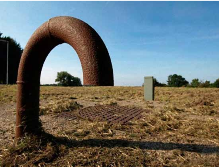
Verwirrendes Stilleben mit Rohrbogen