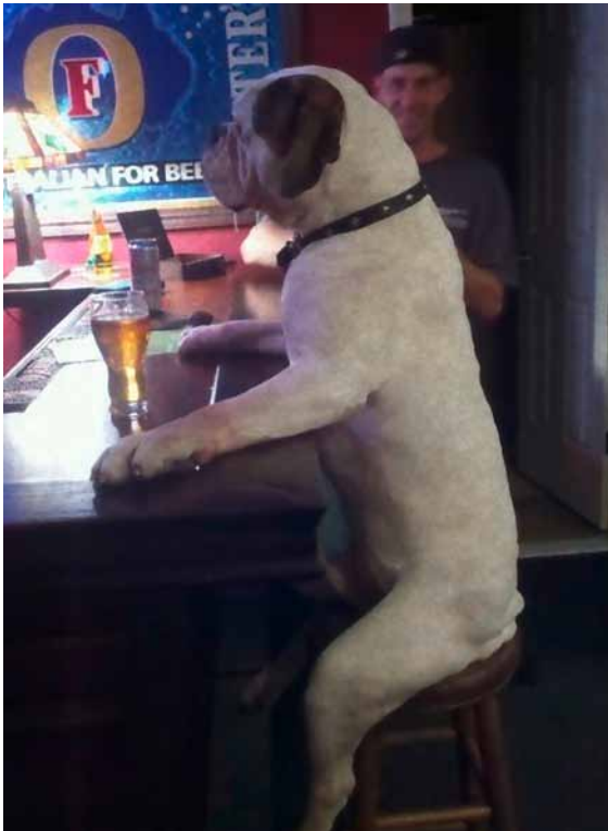
Er kommt jeden Abend hierher und redet kaum etwas.