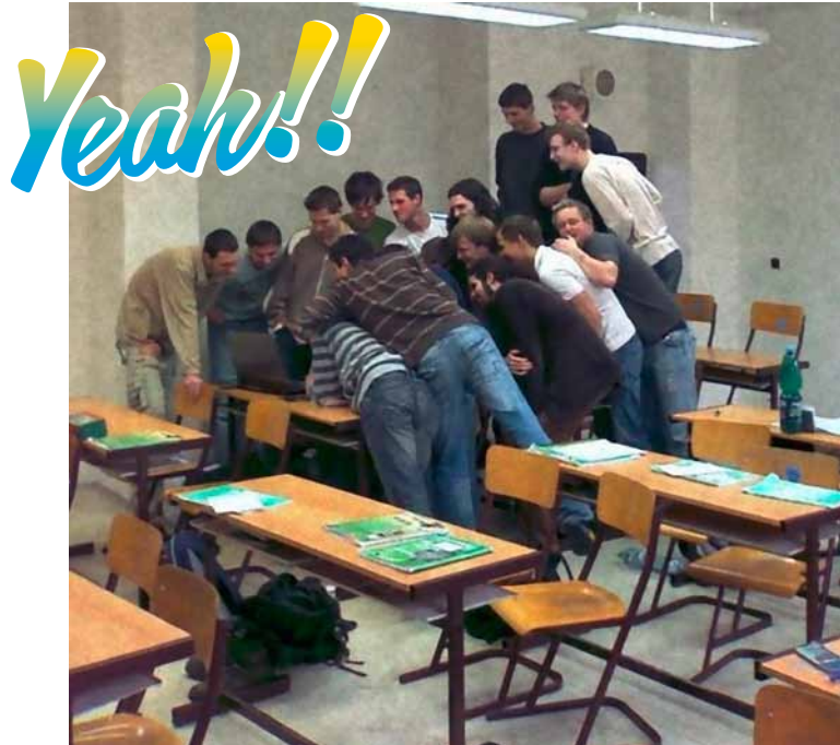
Was, der neue Blog-Beitrag vom SBZ Monteur ist schon einen Tag früher im Netz?!!!