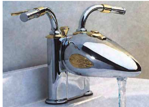
Design-Tipp von einem Motorradfahrer

Dann murmelt er kauend: „Eigentlich hätte ich mir für fünf Euro ja eine ganze Tüte Äpfel kaufen können!“ Entgegnet der andere: „Sehen Sie, es wirkt schon!“