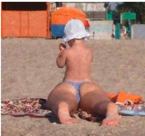
Neulich am Strand

Ohne Spoiler war er nicht stabil bei Höchstgeschwindigkeit, außerdem sieht's deutlich sportlicher aus.