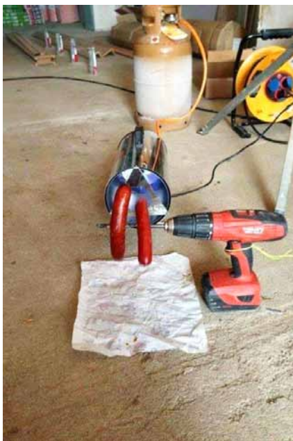
Neulich auf der Baustelle