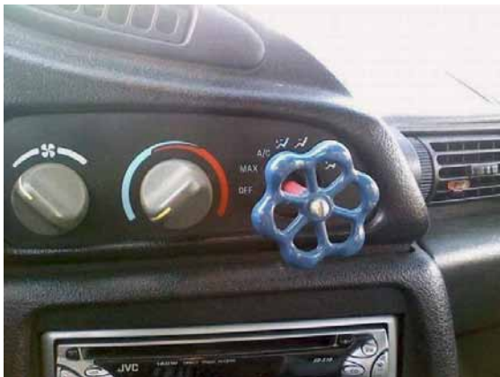
Stilvolle Umstellung des Gebläses

WAS FÜR EINE BESCHUEERTE STATISTIK!? Statistisch leben im Vatikan zwei Päpste pro Quadratkilometer.