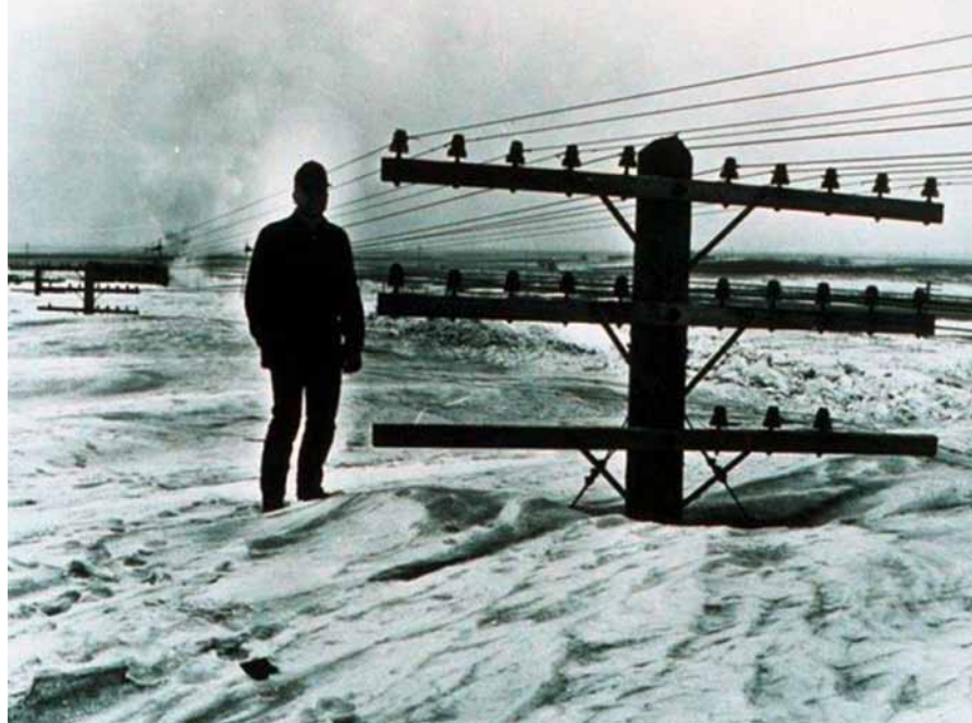
Wetterkapriolen aus längst vergangenen Tagen

KÖLN, INNENSTADT Ein Polizist wird von Passanten alarmiert. Sie bringen ihn zu einem Mann, der in höchster Erregung wie ein Verrückter auf der Straße herumhüpft und immer wieder schreit: „Das darf doch nicht wahr sein, das gibt es doch nicht!“ Fragt ihn der Polizist: „Was ist denn passiert? Kann ich Ihnen helfen?“ „Ich Vollidiot, ich Blödmann! Gestern verkauf' ich mein Auto – und heute find' ich einen Parkplatz!“