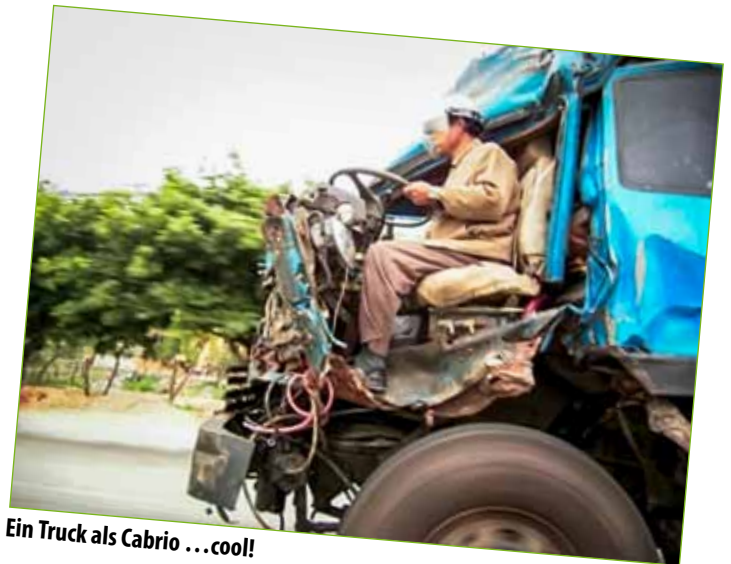
Ein Truck als Cabrio ...cool!