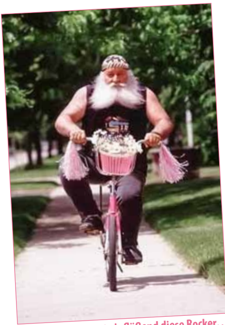
Angst einflößend diese Rocker...