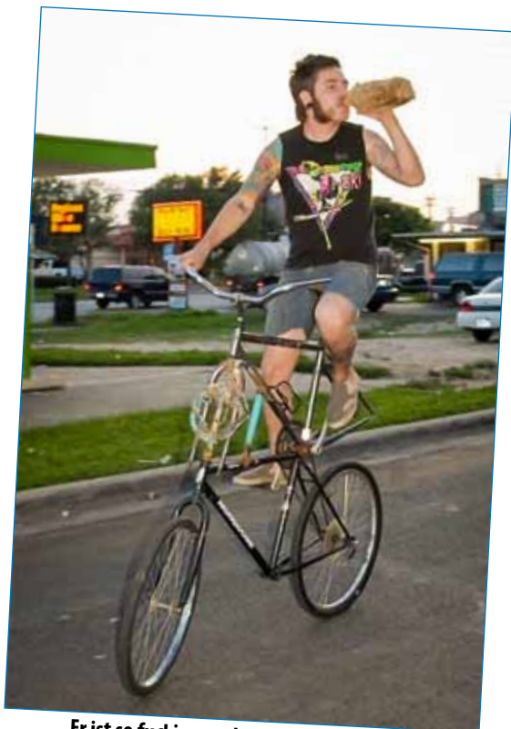
Er ist so fucking cool... , er könnte sie alle haben!