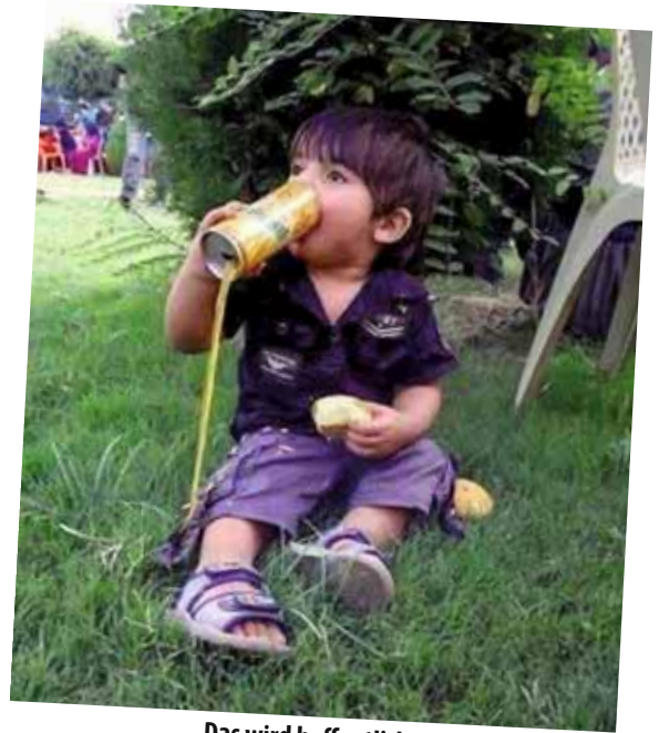
Das wird hoffentlich noch was mit dir ...