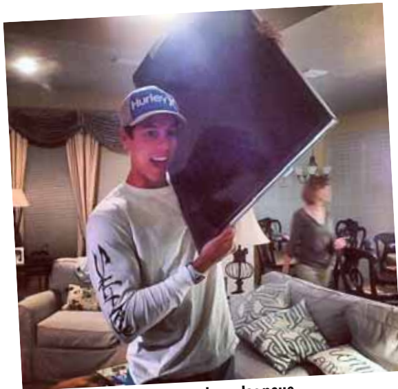
Wow, der Glückliche hat es schon, das neue Samsung Galaxy S9!