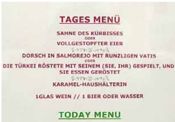
Eine Menü-Karte, wie wir sie wohl alle für den Urlaub erträumen ... und dann auch noch mit Karamell-Haushälterin ... mmmh