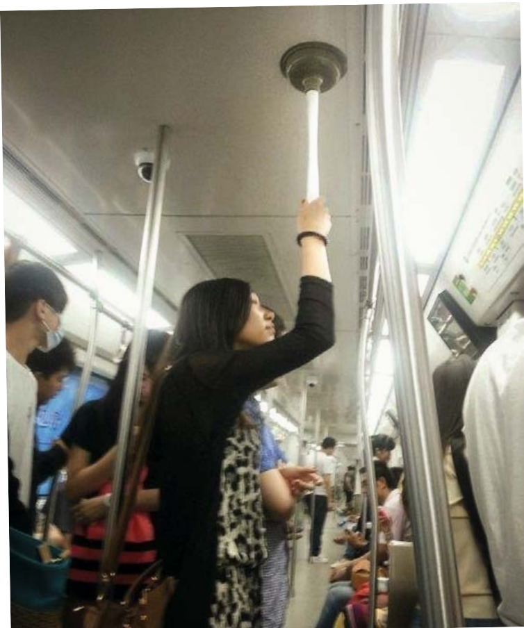
Der berühmte Pömpel in einer weiteren wichtigen Mission eingesetzt ...