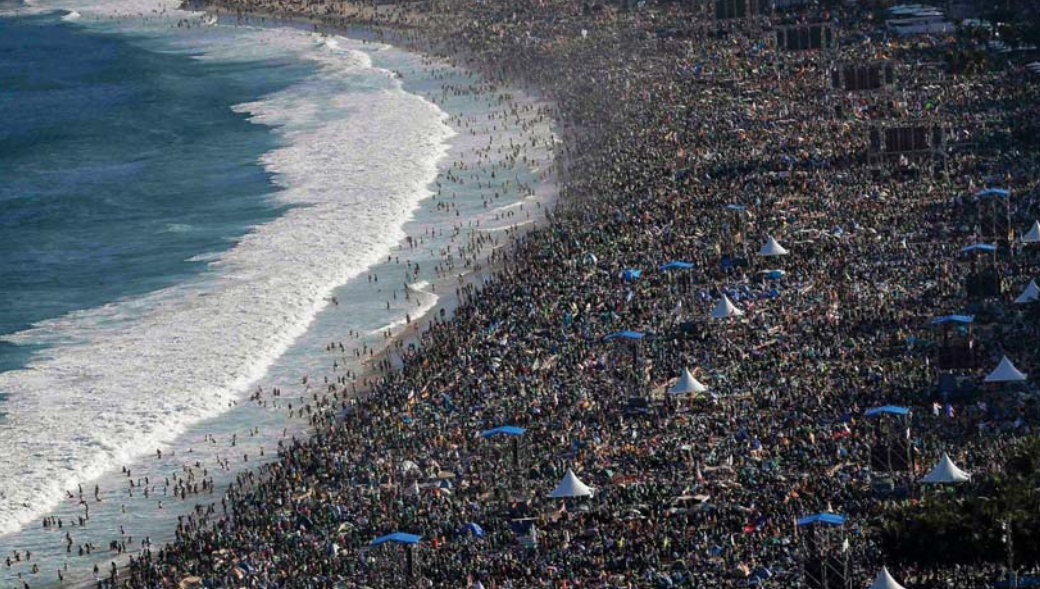
Echt suuper, wir haben fast den gleichen Platz bekommen wie im letzten Jahr...