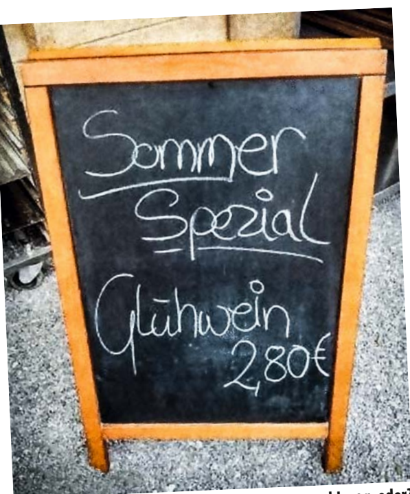
Musste wohl weg, oder?