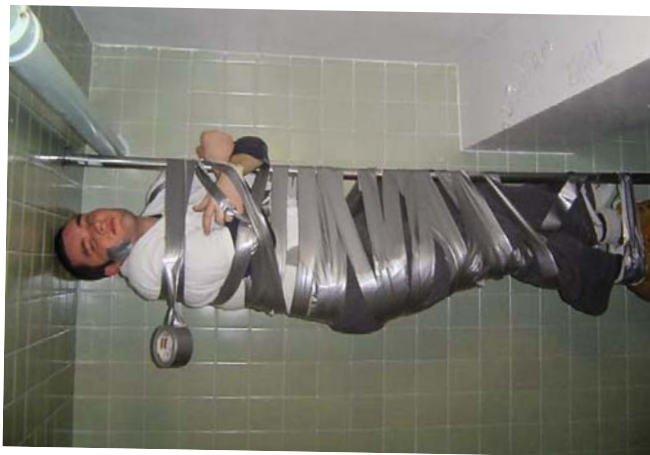
Wenn die Baustelle eher langweilig ist, kann man doch zumindest in den Pausen Spaß haben ...

„Nein, mein Sohn, frag nur, sonst lernst du ja nie was!“