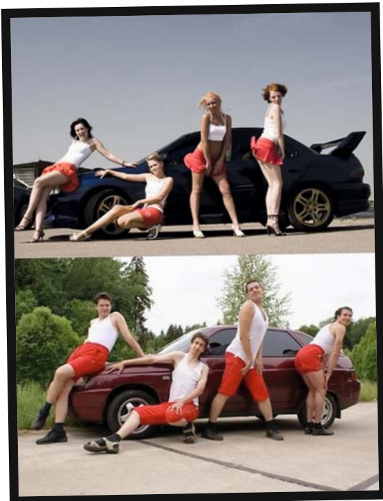
Vergleichende Werbung und was allen sofort auffiel: Die Pose wirkt etwas unnatürlich, bei der Blonden.