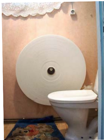
Kloppapier satt ...