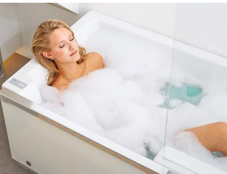
Ein entspannendes Wannenbad in der Easy-in

fühlbadewanne in einem. Steht der Sinn nach einem Vollbad, schließt die elektronische Schiebetür auf Knopfdruck und verriegelt den Durchstieg. Für die tägliche Dusche bleibt die Tür geöffnet. Die Toilette versteckt sich hinter der eingezogenen Wand, an der der Waschtisch inklusive Zubehör montiert wurde. Ein Traum von einem Appartement, deshalb zögerte die Interessentin nicht lang und unterzeichnete den Mietvertrag. Das Ehepaar Kraft ist glücklich, der Umbau war die richtige Entscheidung. Die Mieteinnahmen sind später ein monatlicher Zuschuss zur Rente und die Investition ins eigene Haus eine tolle Wertschöpfung. ■