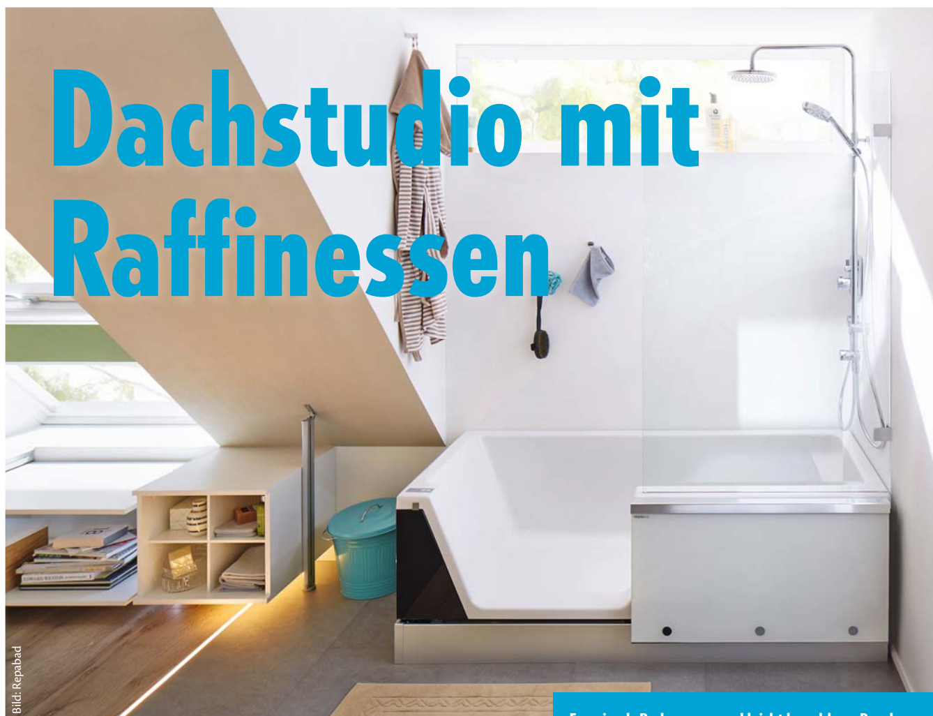
Easy-in als Badewanne und leicht begehbare Dusche

Der bisherige Dachboden wird nach Umbau zur Traumwohnung unter dem Dach. Trotz kleiner Fläche kann die Frage nach Dusche und Badewanne mit Ja beantwortet werden. Easy-in, die Dusche zum Baden, macht es möglich.