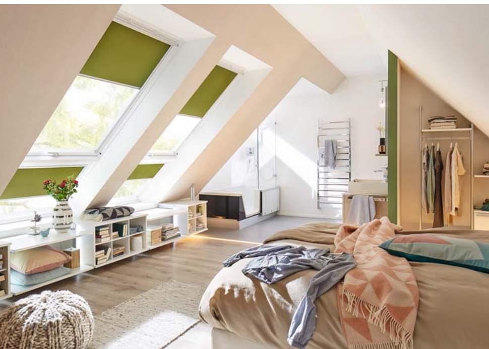
Den Dachraum bestens genutzt und dabei clevere Ideen umgesetzt

nitärleitungen ließen sich entsprechend ins Dach verlegen. Großzügige Dachflächenfenster verleihen der Wohnung jetzt Licht und Weite. Das Einraum-Appartement verfügt über einen Schlaf-/Wohnbereich sowie über ein durch eine Lichtleiste am Boden getrenntes funktionales Badezimmer, das trotz kleiner Fläche Dusche und Badewanne zur Nutzung anbietet. Die angehende Mieterin staunte nicht schlecht, als sie die Wohnung besichtigte und ein modern gestaltetes Dachstudio mit vielen Raffinessen vorfand. Die Studentin hatte sich sofort in das Badezimmer verliebt, denn als passionierte Badenixe freute sie sich über die Kombi-Wanne. Die Duschbadewanne ➔ Easy-in ist großzügige Dusche und geräumige Wohl-