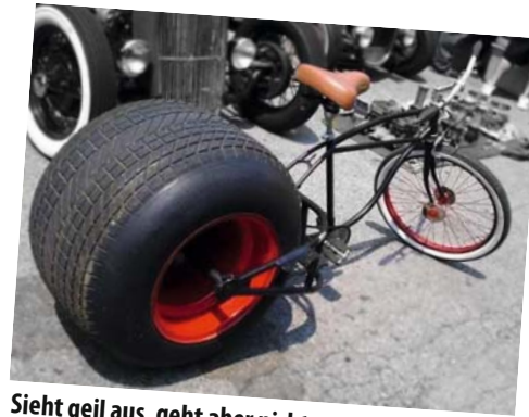
Sieht geil aus, geht aber nicht sonderlich gut ab...