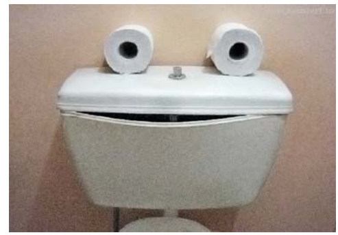
Hebt die Stimmung und verbessert das Geschäft