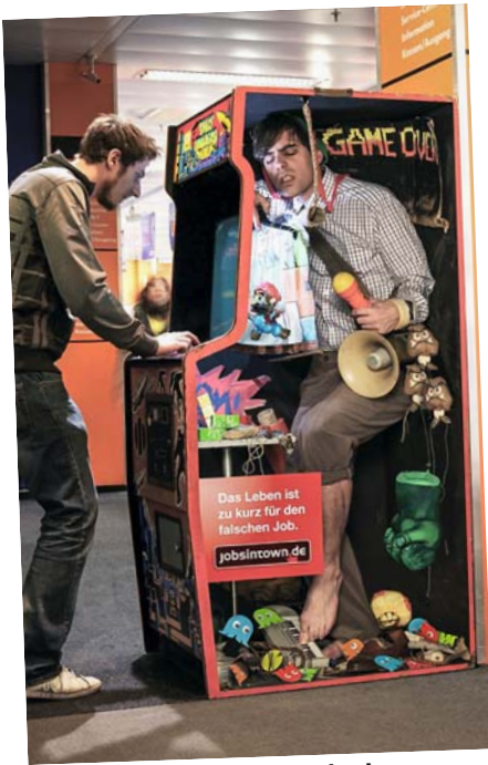
Ich hatte ja keine Ahnung und nahm an, dass das mittlerweile digital läuft ...