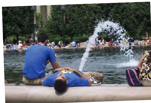
Satter Strahl, alle Achtung!