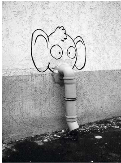
Unsere Welt soll schöner werden...