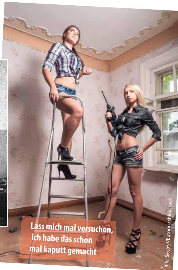
Lass mich mal versuchen, ich habe das schon mal kaputt gemacht