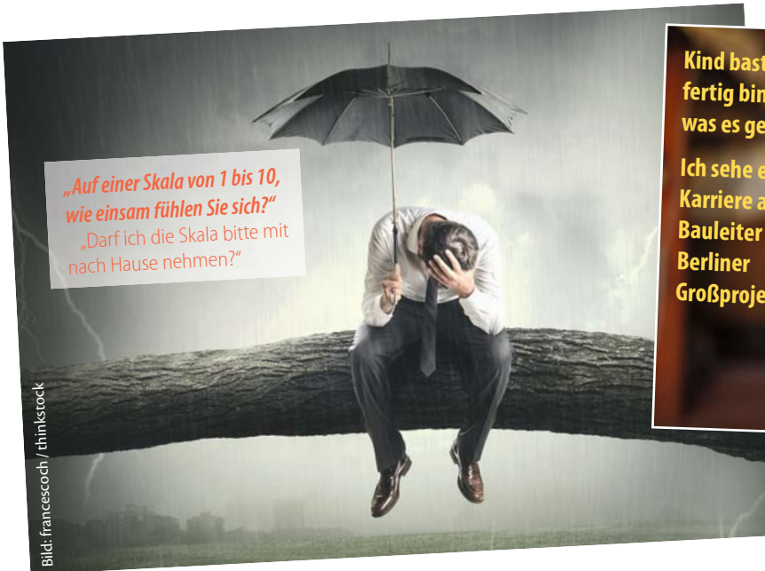
„Auf einer Skala von 1 bis 10, wie einsam fühlen Sie sich?“ „Darf ich die Skala bitte mit nach Hause nehmen?“