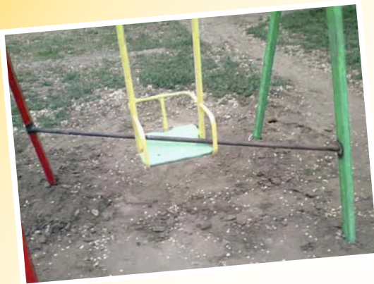
So kann den Kindern nix passieren.