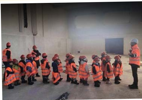
Und ihr müsst den Flughafen BER demnächst fertigstellen