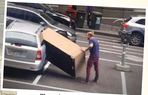
„Was meinst du mit, das passt nicht? Vom Gewicht her oder was?“