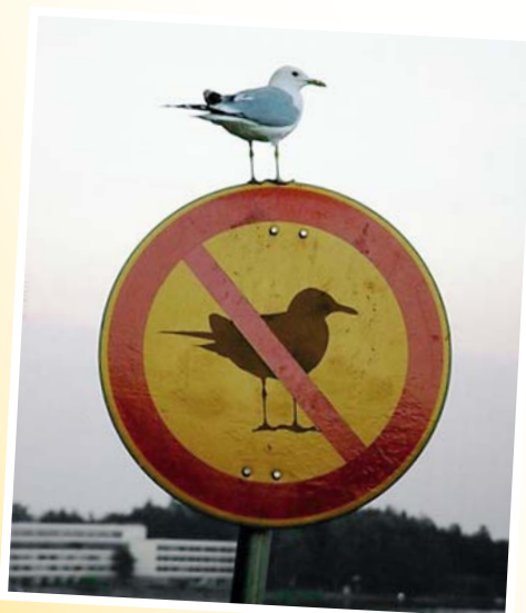
Wer da wohl von wem inspiriert wurde?