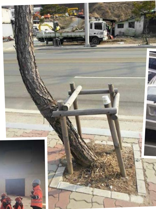
Anarchie ist sogar in der Pflanzenwelt anzutreffen

Niemand schaut später auf sein Leben zurück und erinnert sich an die Nächte, in denen er viel geschlafen hat.