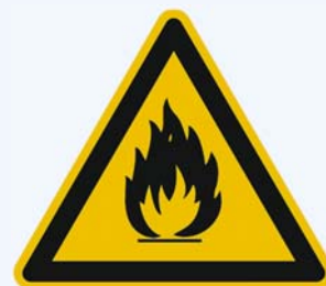
7. Warnung vor