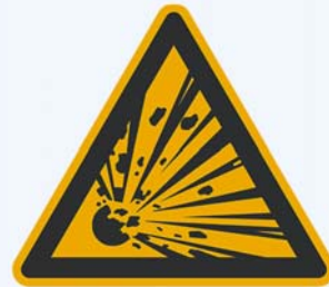
6. Warnung vor