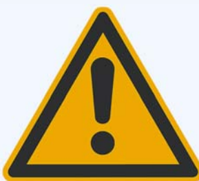
5. Warnung vor