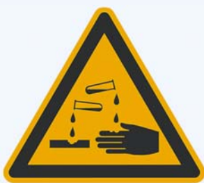
2. Warnung vor