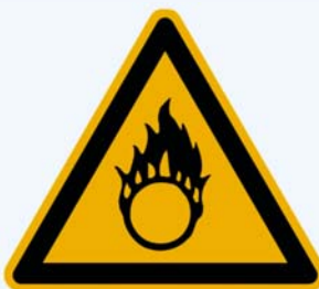
4. Warnung vor