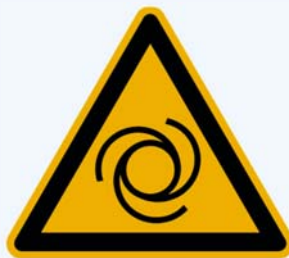
3. Warnung vor