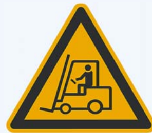
8. Warnung vor