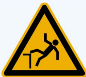
1. Warnung vor

Nachfolgend sehen Sie eine Auswahl von Warnhinweisen die Sie im täglichen Leben immer wieder auf Gefahrenstellen aufmerksam machen sollen. Markieren Sie in den zugeordneten Bezeichnungen die jeweils einzig richtige.