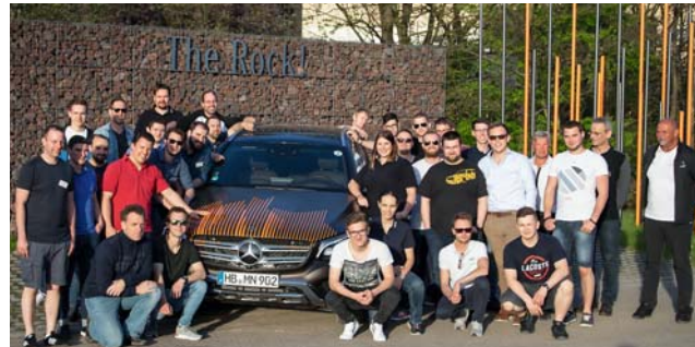
Spaß gehörte auch zum letzten Starter-Camp in Bremen

Zugeschnitten auf den Bedarf junger Fachhandwerker bietet Wöhler, der Hersteller von Messgeräten aus Bad Wünnenberg, Unterstützung für den Nachwuchs. Lesen Sie, wie man diese Vorteile für sich nutzt und dabei Spaß haben kann.