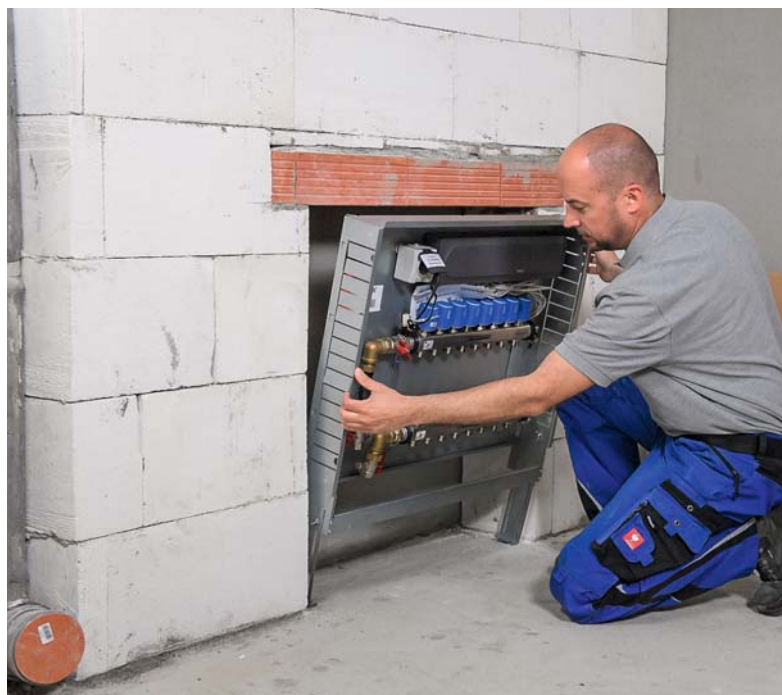
Die Verteilerstationen von Uponor werden komplett vorgefertigt geliefert

Wer möchte bei dem hohen Auftragsdruck heutzutage noch Verteilerstationen für Flächenheizungssysteme aufwendig und zeitraubend montieren? Sie auch nicht? Dann lesen Sie, wie unsere Industriepartner das SHK-Handwerk unterstützen möchten.