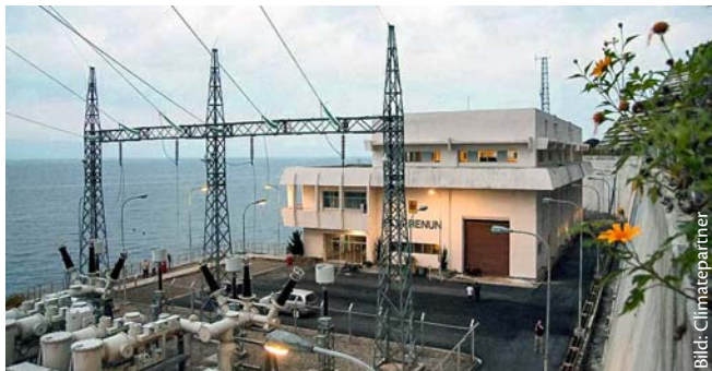
Ein Kraftwerk auf Sumatra sorgt für einen CO 2 -Ausgleich

ClimatePartner ist ein führender Lösungsanbieter im Klimaschutz für Unternehmen. ClimatePartner berät Unternehmen bei Klimaschutzstrategien und zu Reduktion und Ausgleich von Treibhausgasemissionen. Das Unternehmen wurde 2006 in München gegründet, beschäftigt heute 40 Mitarbeiter an Standorten in Deutschland, Österreich und in der Schweiz und hat mehr als 1000 Kunden in 30 Ländern. ClimatePartner arbeitet eng mit Umweltverbänden zusammen und stellt Experten in verschiedenen internationalen Ausschüssen.